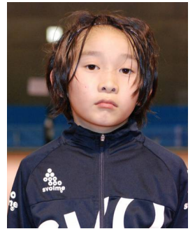
3 年生 はる