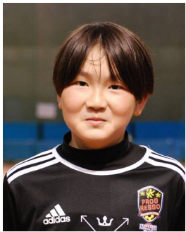
4 年生 れや