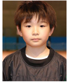
4 年生 あつま