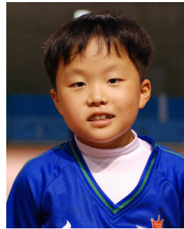
3 年生 そうや