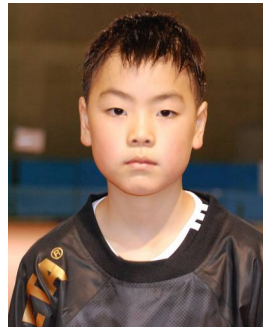
3 年生 とも